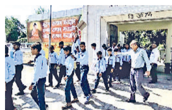
रैली निकाल कर स्वच्छता का संदेश देते विद्यार्थी।