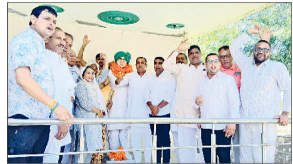
रेवाड़ी। ताऊ देवीलाल को नमन करते जेजेपी कार्यकर्ता।