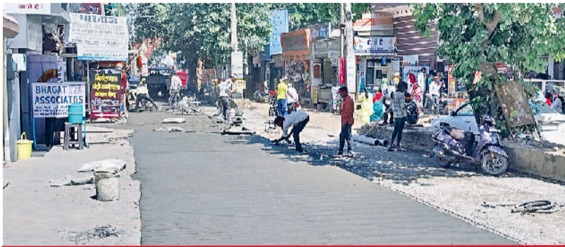
अग्रसेन चौक से भाड़ावास गेट के बीच शुरू हुआ सड़क निर्माण कार्य

नगर परिषद की ओर से बाजार के सीसी रोड के कार्य को दिसंबर तक पूरा करने का लक्ष्य रखा गया है, लेकिन सड़क निर्माण कार्य काफी धीमा चल रहा है।