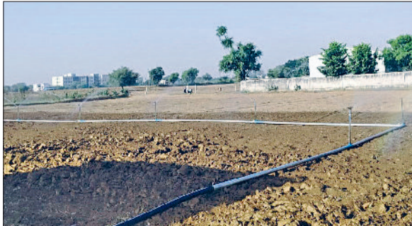
रेवाड़ी। जुलाई के बाद एक खेत में चलते हुए फव्वारे।

रहा। अधिकतम तापमान 0.3 डिग्री बढ़कर 37.5 पर पहुंच गया। न्यूनतम तापमान 0.8 डिग्री की कमी के साथ 19.8 डिग्री सेल्सियस दर्ज किया गया। 11 किलोमीटर प्रति घंटा की गति से हवाएं चलें, जबकि नमी