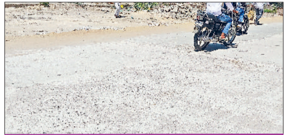
बास मार्केट की नई सड़क पर दिखने लगी रोड़ियां

शहर के बास मार्केट में सीएम घोषणा के अनुसार 2.62 करोड़ रुपये की लागत से सीसी रोड, सौवर व पार्क का कार्य शुरू किया गया था। व्यापारियों और पार्श्वों की मांग पर सरकार ने मार्केट में सीसी रोड के लिए मंजूरी दी। सीसी रोड बनाने का कार्य मार्च के अंत में शुरू किया गया था। मार्केट की अंदर की सड़कें बनाने के बाद लास्ट में बरसात के सामने की सड़कें की बनाया गया, लेकिन इस सड़क की एक महीने में ही रोड़ियां दिखने लगी है। बास मार्केट अंदर बनाई गई सड़क भी जगह-जगह से क्षतिग्रस्त हालत में है। पिछले दिनों विजिलेंस की टीम की ओर से मॉडल टाउन, सेक्टर-3 व वार्ड नंबर-2 की नई सड़कों के संपल भी लिए गए थे, लेकिन अभी तक कोई कार्रवाई नहीं की गई है। इसके अलावा बास मार्केट के तिकोना पार्क का कार्य भी लंबे समय से अधूरा पड़ा हुआ है। पार्क की बनाई गई चारदीवारी जर्जर हालत में आती जा रही है।