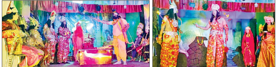
रेवाड़ी। ड्रामेटिक क्लब की रामलीला में लक्ष्मण-परशुराम का संवाद, पुष्प वाटिका में श्रीराम के दर्शन करती सीता।