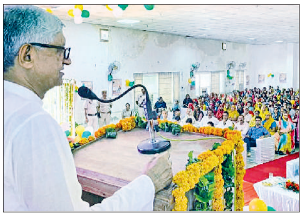
रेवाड़ी। गुरुवार को दीन दयाल लाडो लक्ष्मी योजना के शुभारंभ अवसर पर संबोधित करते हुए राज्यसभा सांसद रामचंद्र जांगड़ा।