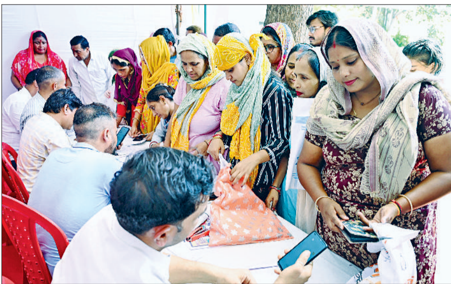
रेवाड़ी। लाडो लक्ष्मी मोबाइल एप में रजिस्ट्रेशन कराती महिलाएं।