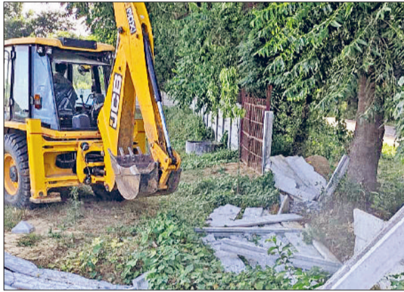
रेवाड़ी। अवैध निर्माण तोड़ती डीटीपी की जेसीबी।

डीटीपी की टीम ने वीरवार को शहर की राजस्व सीमा में अवैध रूप से विकसित हो रही लगभग 4 एकड़ की अवैध कॉलोनी में तोड़फोड़ की कार्रवाई की। डीटीपी की इस कार्रवाई से अवैध रूप से निर्माण करने व कॉलोनीयां काटने वाले लोगों में